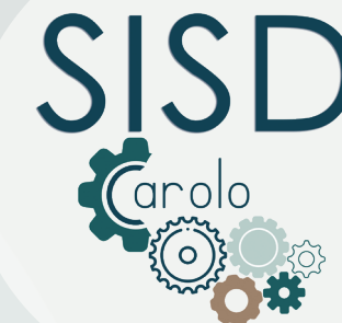
Plate-forme de concertation et de soutien pour l'ensemble des prestataires de soins ambulatoires

Editeur responsable : Mr Claude Decuyper 071/33.13.23